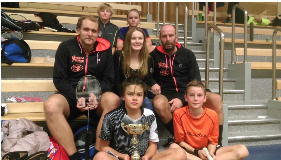
Bästa klubb DM 2016 blev för andra året i rad Kilafors BMK!